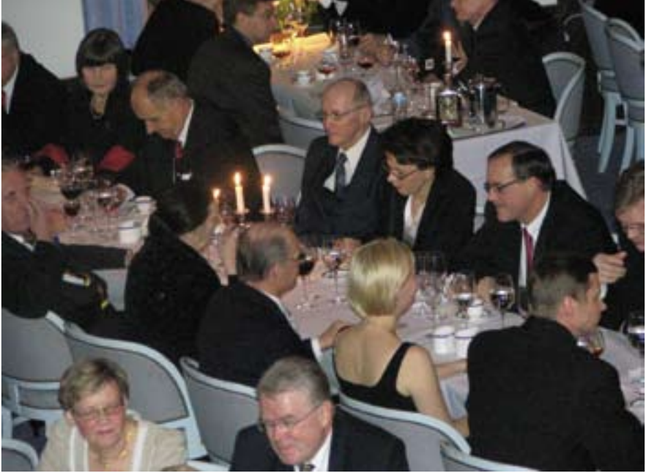
Vuosikokousillallinen Kalastajatorpalla 2006.