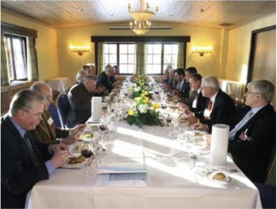
Seuran kunniajäseniä ja puheenjohtajia lounaalla Kalastajatorpan siirtomaasalissa vuonna 2006.