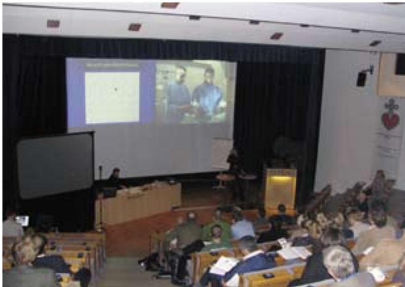
PCI livenä Dipolissa vuonna 2005.

Vuonna 1981 syyskokous järjestettiin Oulussa ja vuosina 1983-84 Tuusulan kunnallisopistolla. Aiheina olivat noninvasiiviset tutkimusmenetelmät, sydä-