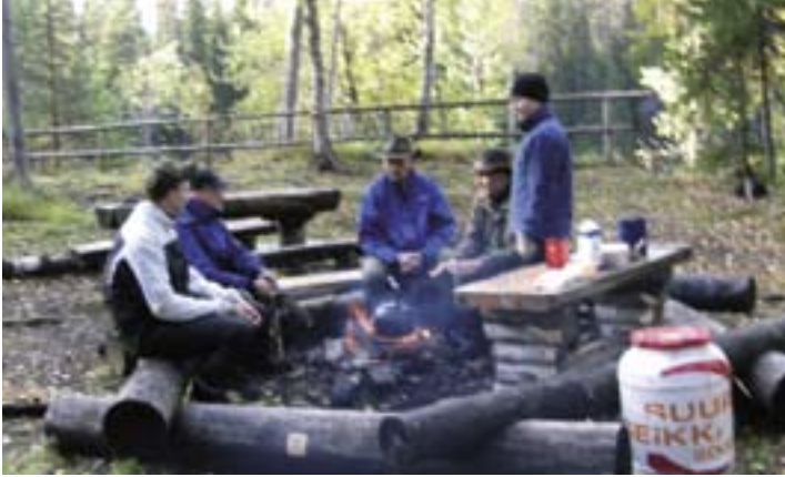
Hallitus Rukalla suuressa seikkailussa vuonna 2004.